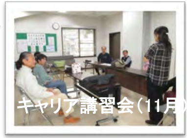
キャリア講習会(11月)