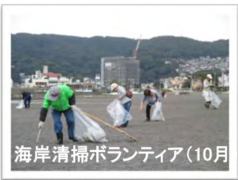
海岸清掃ボランティア(10月)