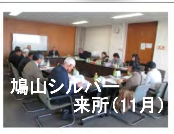
鳩山シルバー 来所(11月)