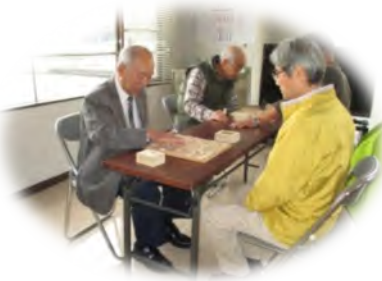
互助会同好会 将棋部活動風景