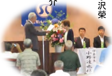
【平成28年度事業実績】