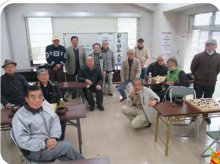
第7回 シルバー囲碁大会対戦成績表 大会期間: 2023年 1月11日(水)から2月1日(水)まで