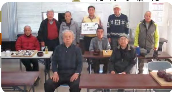
第9回 シルバー囲碁大会対戦成績表 大会期間：2024年2月28日(水)から3月27日(水)まで